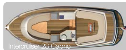
Inter cruiser 28 Cabrio