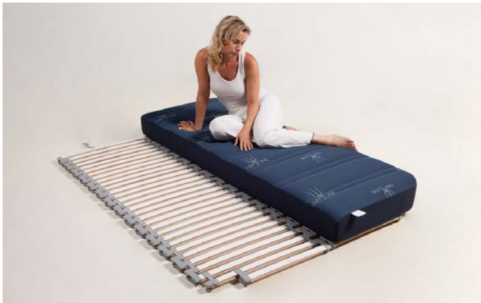
Flexibele lattenbodems voor goede ventilatie en verbeterd slaapcomfort.

Graanmarkt 4 1681 PA Zwaagdijk-Oost +31 (0)228-562045 info@neptune.nl www.neptune.nl