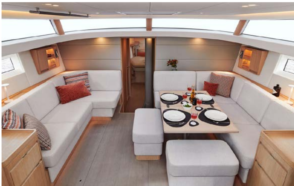
Bij Neptune kunt u ook terecht voor uw complete scheepsstoffering.