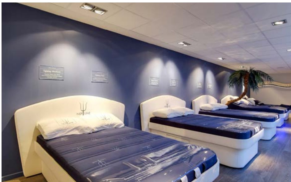
Vrijblijvend proefliggen in het vernieuwde Neptune Experience Centre.