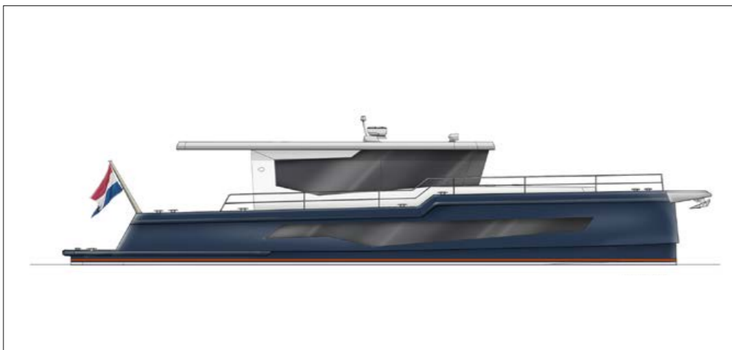
De Rover is solide gebouwd, ruim en klaar voor elk avontuur.