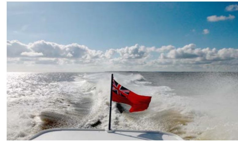
Grote golven, dat wil je dus niet!

Ook de vorm van de spiegel, de achtersteven, speelt een cruciale rol. Bij lage snelheden is het beter als hij smal is en niet diep in het water steekt. Dan kan het water ongestoord wegstroomen, de weerstand neemt af. Precies wat je wilt. Maar zodra het schip sneller gaat, betekent weinig volume aan de achtersteven dat het schip aan de achterkant zinkt en zich ingraaft. Dat leidt tot hoge golven en een inefficiënte werking. Dat wil je niet. Voor een optimale romp zou het dus mogelijk moeten zijn om tegelijkertijd een zo klein mogelijk spiegeloppervlak te combineren met voldoende lift bij hogere snelheden. De ingenieurs hebben hier ook iets op bedacht. Wat dat is, kan echter nog niet worden onthuld in dit artikel.