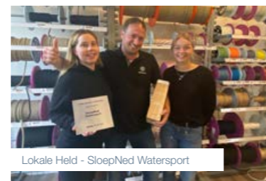
Lokale Held - SloepNed Watersport