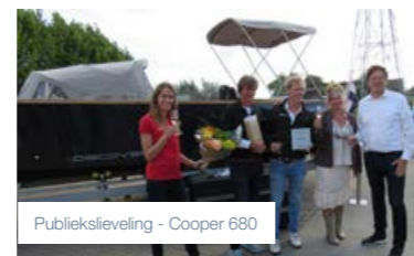
Publieksleveling - Cooper 680