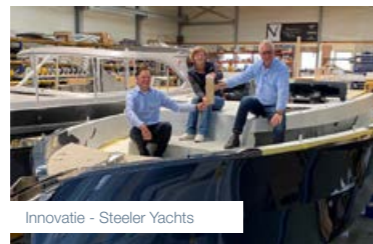
Innovatie - Steeler Yachts