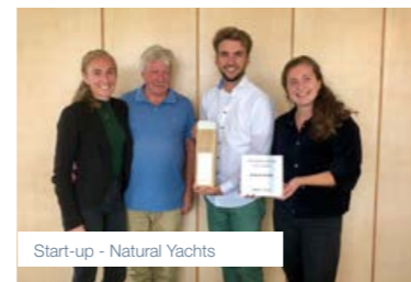
Start-up - Natural Yachts